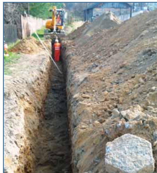
Rozbudowa kanalizacji na terenie Gminy Zagórze.

Głównym celem projektu jest poprawa atrakcyjności i konkurencyjności społeczno-gospodarczej Gminy Zagórze oraz Miasta Horodok, poprzez wykorzystanie potencjałów rozwojowych obu partnerów w zakresie turystyki. O rozwoju tej branży nie sposób myśleć bez dbałości o odpowiednią jakość środowiska naturalnego, co z kolei ma bezpośrednie przełożenie na wzrost standardu życia lokalnych społeczności. Prace budowlane związane z realizacją projektu toczą się już po obu stronach granicy. W przypadku Gminy Zagórze ekipy budowlane pracują na terenie dzielnic: Leska Góra, Pod Klasztorem, Wielopole oraz w miejscowości Poraż.