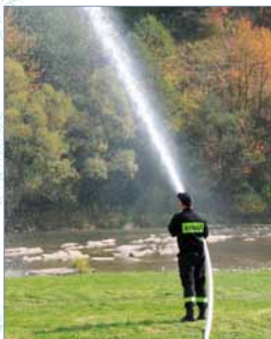
KRANÓWKA TRYSNĘŁA W GÓRĘ!