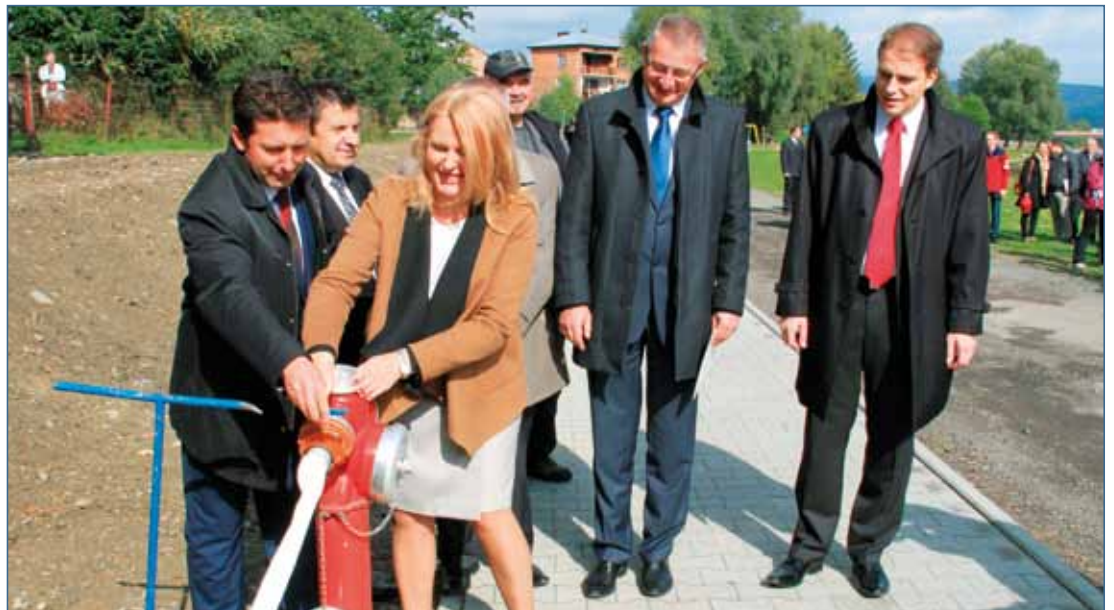
Zamiast cięcia wstęgi było odkręcanie zaworu na hydrancie.

Tym ostatnim trudno było uwierzyć w to, że jeszcze do niedawna woda pitna o względnie dobrej jakości była dla wielu zagórczan luksusem. Z jej deficytem radzono sobie w Zagórze m.in. posiłkując się ograniczonymi zasobami „źródełka” zlokalizowanego przy nadosławskiej promenadzie. Miejsce to straci na znaczeniu jako punkt poboru wody pitnej dzięki projektowi pn. „Budowa sieci wodociągowej dla części miejscowości Zagórze