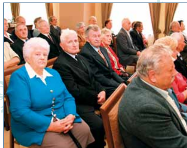
PRZEŻYLI Z SOBĄ TYLE LAT!