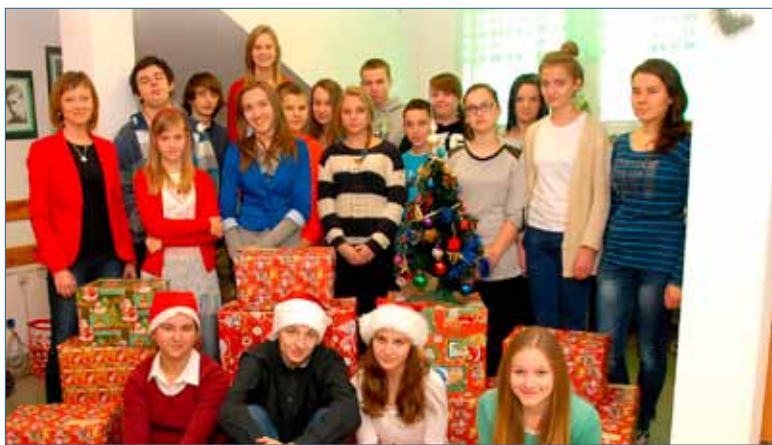
Wolontariusze z zagórzskiego Gimnazjum.

Podziwiając młodzieżowych filantropów, pozostaje mieć nadzieję, że dzięki ich ofiarności i wrażliwości nadchodzące święta Bożego Narodzenia będą dla wybranej przez nich rodziny czasem wiary w drugiego człowieka, nadziei na lepsze jutro i miłości, która daje siłę.