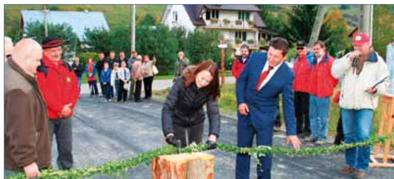
Jeszcze jedno cięcie... siekierą i szlak turystyczny w Łukowem będzie oficjalnie otwarty!

się na biesiadę turystyczną, zorganizowaną w świetlicy wiejskiej w Średnim Wielkim. Podczas spotkania z udziałem fachowców, którzy zawodowo i społecznie zajmują się organizacją i promocją turystyki, dyskutowano o perspektywach jej rozwoju na terenie Gminy Zagórze. Urozmaiceniem niezwykle owocnej wymiany doświadczeń i pomysłów była degustacja potraw regionalnych oraz uczta muzyczna, o którą zadbały zespoły folklorystyczne „Łukowianie” z Łukowego i „Połańce” ze Średniego Wielkiego. – Mam nadzieję, że projekt ten unaoczní nie tylko mieszkańcom Łukowego, jak wielki potencjał ma nasza rodzima przyroda i kultura. W każdej miejscowości można odnaleźć osobliwości historyczne i przyrodnicze, których odpowiednie zagospodarowanie i promocja stwarzają warunki do rozwoju turystyki. W tym sensie inicjatywę Stowarzyszenia Rozwoju i Promocji Wsi Łukowe można nazwać modelową. Podobne działania w ramach tego samego szwajcarskiego programu zrealizowano w Porażu. Tam powstał bardzo urokliwy minipark. Łukowe ma swój szlak turystyczny. Szanse na tego rodzaju obiekty mają pozostałe miejscowości, bo już w styczniu 2014 roku rozpoczyna się kolejny nabór do Górskiego Funduszu Organizacji Pozarządowych – zauważa burmistrz Zagórze Ernest Nowak .