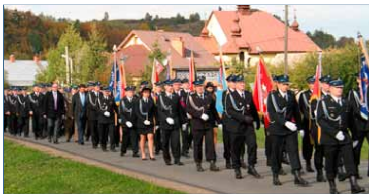
Jubileusz OSP Mokre zgromadził liczne grono uczestników

Bezpośrednio po zakończeniu oficjalnej części uroczystości jej uczestnicy zostali zaproszeni na poczęstunek, przygotowany przez członkinie Koła Gospodyń Wiejskich w Mokrem. Strawy duchowej w postaci wzruszającego montażu słowno - muzycznego dedykowanego strażakom dostarczyli uczniowie miejscowej szkoły podstawowej wspierani przez członków Zespołu Pieśni i Tańca „Osławiany”