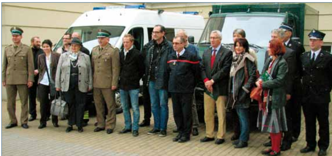
Pamiątkowe zdjęcie na zakończenie wizyty w Placówce Straży Granicznej w Sanoku.

W dniach 29 września – 3 października br. samorządowcy i młodzież z Villars-sur-Glâne odbyli wizytę studyjną w Gminie Zagórz będącą finałowym akcentem projektu pn. „AKADEMIA DEMOKRACJI ROZWOJU”, który uzyskał ponad 320 000 zł dofinansowania Funduszu Partnerskiego Szwajcarskiego Grantu Blokowego.