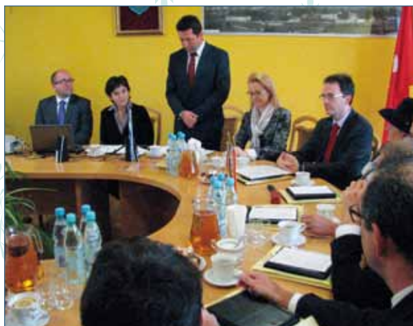
SZWAJCARSCY PARTNERZY ODWIEDZILI GMINĘ ZAGÓRZ