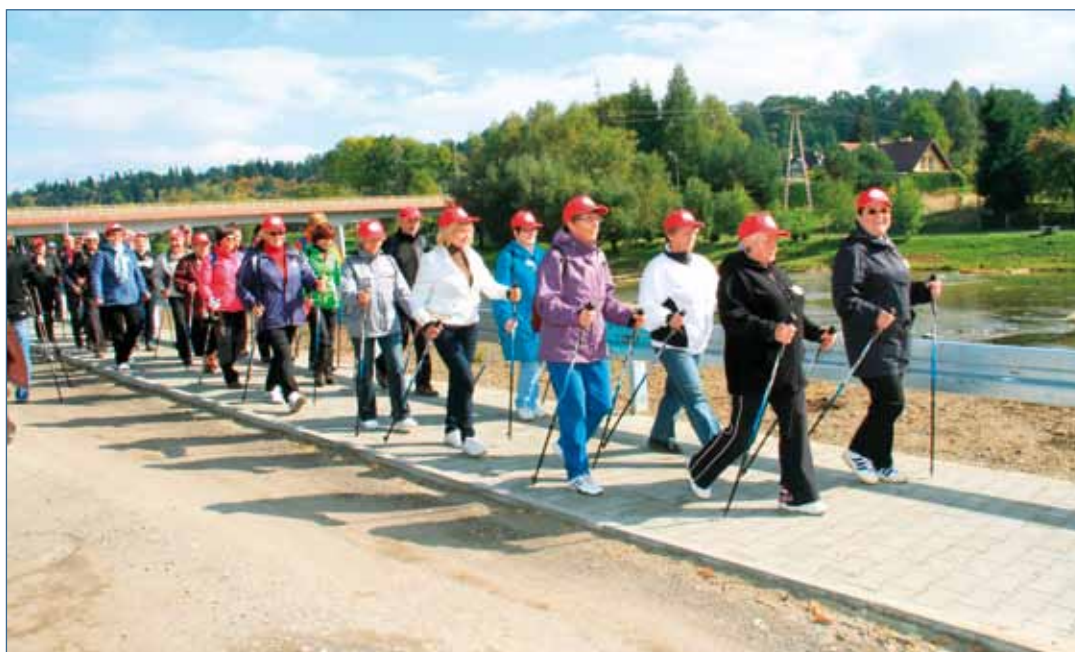
Uroczystość zgromadziła licznych sympatyków nordic walking z Zagórze i Svidnika

Opisywana tu ścieżka stanowi kluczowy element inwestycyjny projektu pn. „Rozwój turystyki i aktywizacja osób 50+ w Zagórze i Svidniku”. Na realizację tego przedsięwzięcia Gmina Zagórze otrzymała ponad 55 tys. euro, w ramach Programu Współpracy Transgranicznej Rzeczypospolita Polska – Republika Słowacka 2007-2013. Spacerowo – rowerowy trakt wybudowany wzdłuż nadodrzańskiej promenady połączył ul. Mickiewicza i Rzeczną - biegnące w rejonie popularnej plaży. Ze ścieżki mogą korzystać zarówno rowerzyści, jak i piesi, a w szczególności ci, którzy uprawiają niezwykle modny ostatnio marsz z kijkami, czyli nordic walking. Miłośników tego sportu ostatnio w Zagórze stale przybywa, gdyż w ramach opisywanego tu projektu stało się możliwe wyposażenie w sprzęt (kijki) oraz przeszkolenie dwóch piętnastoosobowych grup z Zagórze i Svidnika, w wieku powyżej 50 lat. Skąd wziąć się akurat