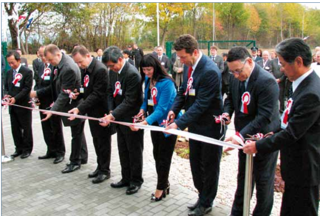
Uroczyste przecięcie wstęgi

do struktury wiekowej załogi. W Zagórzu pracują zarówno dwudziestolatkowie, jak i osoby w kategorii wiekowej „50+”. – Cieszę się, że w Zagórzu na przekór przedłużającemu się kryzysowi ekonomicznemu udało się stworzyć nam nowe miejsca pracy. Dają one ludziom szansę na stabilizację materialną i społeczną, a gminie na rozwój – podkreślał Ernest Nowak - burmistrz Zagórza.