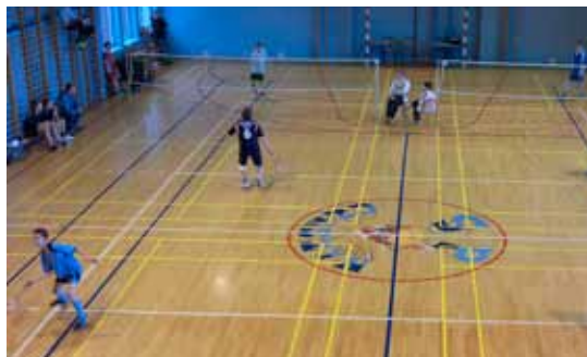
Obie badmintonowe imprezy w Czaszynie dostarczyły wielu sportowych emocji

Najlepszym potwierdzeniem tytułowej tezy są wyniki dwóch prestiżowych zawodów badmintonowych, które na przełomie listopada i grudnia br. odbyły się w hali sportowej Szkoły Podstawowej w Czaszynie.